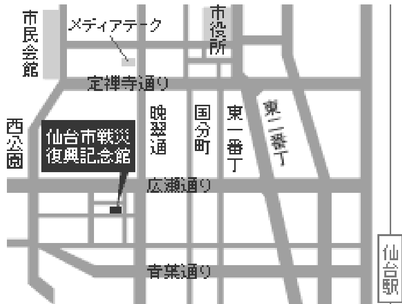
戦災復興記念館案内図