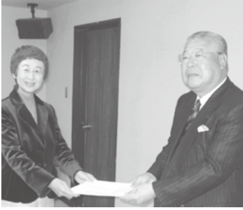
h 21/11/13 西下会長が奥山恵美子市長に陳情。(梶原副会長・伊藤税制委員長同席)