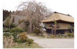
— 35 話 —

名取市にある洞口家住宅を訪ね、囲炉裏を囲んで「歴史・生活文化」についてお話を伺いました。