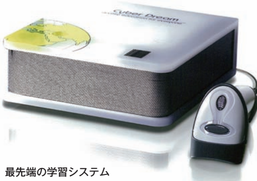
最先端の学習システム サイバードリーム www.dreamsclub.com

確かに、社長が地道に汗を流し、努力を重ねた姿には、多くの方々との出逢いと満面の笑み、そして、喜びに満ちた達成感を得ることが出来たと誰もが納得した様に思いました。その後、数々のメディアにも取り上げて貰い、いざ、独自の商品を宮城県から発信していかうと息込んでいた矢先、思いも寄らぬ東日本大震災に見舞