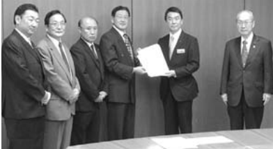
村井嘉浩宮城県知事へ陳情