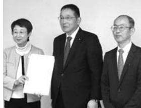
奥山恵美子仙台市長へ陳情

当法人会では、仙台北法人会・仙台中法人会と共に毎年恒例となっており、税制改正要望の陳情を十一月七日(金)奥山恵美子仙台市長、西澤啓文仙台市議会議長、十一月十一日(火)村井嘉浩宮城県知事、安藤俊威宮城県議会議長へ直接、陳情を行いました。