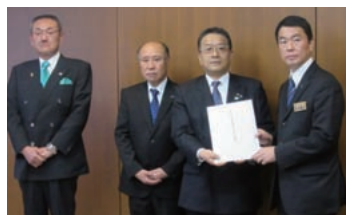
村井県知事へ陳情