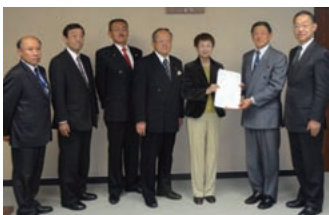
奥山仙台市長へ陳情